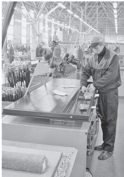
В производственном цехе предприятия